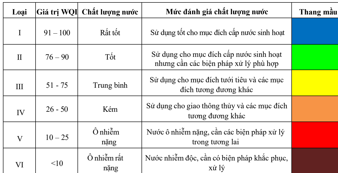
Bảng 2. Thang đo giá trị WQI và mức đánh giá chất lượng nước tương ứng